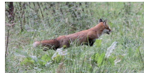
L'utilisation de collets à arêteiro nécessite une autorisation de destruction !

Attention, il est rappelé que l'utilisation de collets est soumise à autorisation de destruction. Des formulaires préétablis de demande de destruction existent et sont disponibles auprès du secrétariat, auprès du DNF et sur le site du R.S.H.C.B. ( www.chasse.be/services/formulaires ).