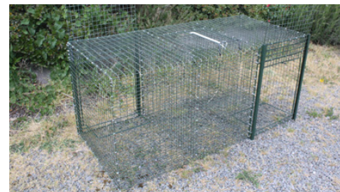
Les cages à corvidés représentent un moyen efficace de lutter contre la prédation du petit gibier

Attention, une autorisation de réguler les corvidés est nécessaire et obligatoire. Vous la trouverez jointe au présent fascicule.