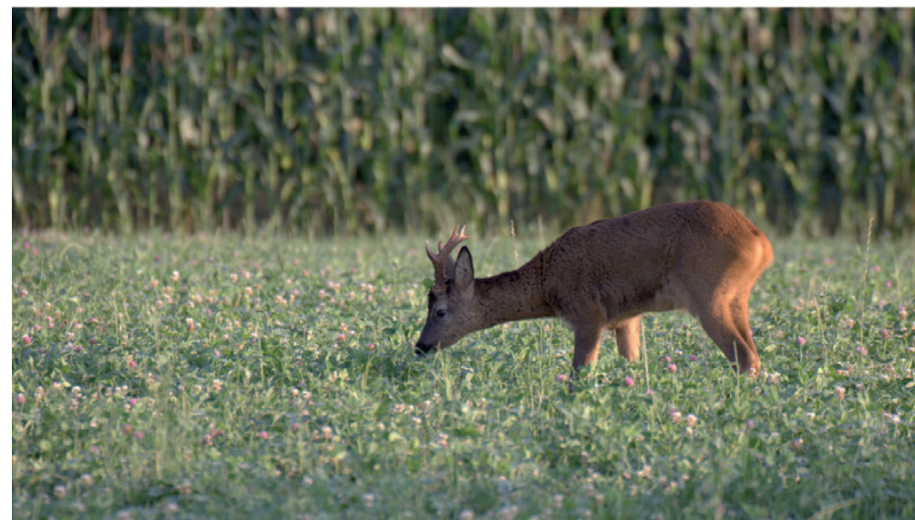
N'attendez pas la dernière minute pour demander vos bracelets grand gibier

Le Royal Saint-Hubert Club de Belgique organise et propose différentes façons de se préparer au mieux aux épreuves. Ainsi un kit didactique « Réussir l'examen de chasse 2014 » est disponible, des formations à l'épreuve théorique (à Bruxelles et en Wallonie) avec séance de révision, ainsi que des préparations aux deux épreuves pratiques sont proposées. Pour tout renseignement : info@rshcb.be ou 081/30.97.81.