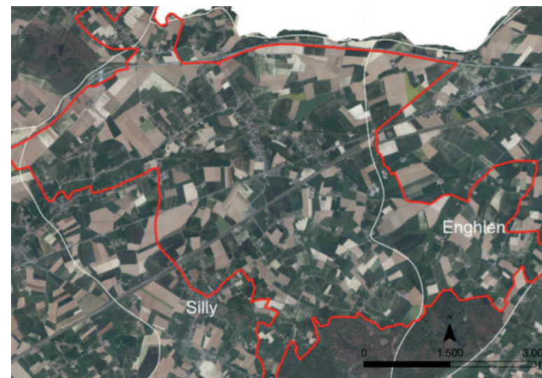
Figure 2 : Représentation cartographique de la zone de projet CC3R (en rouge) et des communes impliquées (en blanc).

L'éco-conseiller de la commune de Silly (commune couvrant la quasi-totalité de la zone (voir figure 2)) s'est montré proactif en participant dès le départ à la première réunion d'informations pour le lancement de cette zone. Des projets communs d'aménagements sur des sites communaux sont tout à fait envisageables et pourraient concilier intérêt biologique et rentabilité des travaux communaux. Suite à différents entretiens, des propositions concrètes d'aménagement doivent donc désormais être proposées.