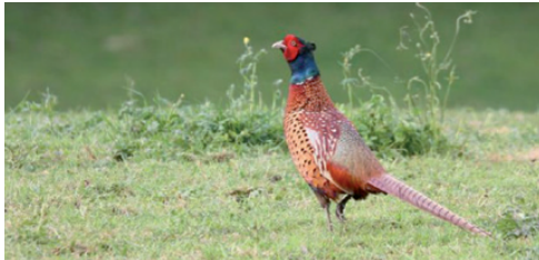
L'avenir du petit gibier passe notamment par des efforts d'aménagement

Le montant de l'aide est plafonné à une expertise de l'a.s.b.l. Faune & Biotope ou une intervention par territoire de chasse qui ne sera en aucun cas supérieure à la moitié du prix des travaux, à l'exclusion de la main d'œuvre et plafonnée à 150 euros.