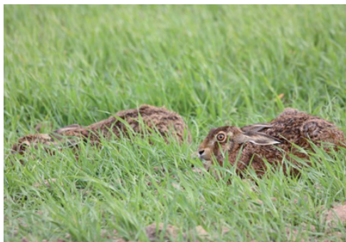
Nous effectuerons un relevé d'indice kilométrique d'abondance du lièvre lors de deux soirées sur février

Les résultats seront communiqués à l'Administration et publiés dans notre prochain fascicule de contact (juin/juillet).