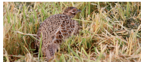
L'acquisition de meilleures connaissances participe à une gestion raisonnée des espèces

Pratiquement, l'inscription est prise via le site www.chasse.be/formations ou auprès du secrétariat du RSHCB (081/30.97.81). Le coût de la formation est de 150,00 euros comprenant le syllabus, les cours, visites et conférences.